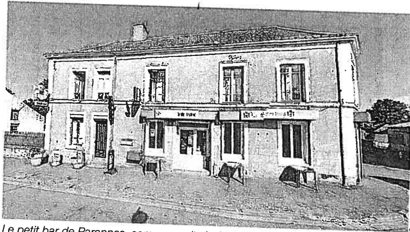
Le petit bar de Parnennes, commune située à 9 km de Sillé-le-Guillaume, est en sursis.

Mariée à un chauffeur routier, la commerçante ne dégage que quelques milliers d'euros par an avec le Sporting bar. Or, si elle est condam-